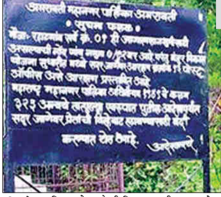
विभाग ने दूसरे ही दिन उपअधीक्षक तहसील भूमि अभिलेख कार्यालय से अगले निर्देशों तक मनापा प्रशासन ने इस जगह पर अंतिम विधि करने

प्रतिनिधि/प्रतिदिन अखबार अमरावती, 23 दिसंबर - रहाटगांव की शमशानभूमि का विवाद फिर उभरकर सामने आया है. यहां पर बड़े पैमाने पर सुविधाओं का अभाव रहने से नागरिकों ने शमशानभूमि के निर्माण कार्य के लिए मनापा आयुक्त और जिलाधीश को ज्ञापन सौंपा था, लेकिन प्रशासन ने इसकी कोई दखल नहीं ली. इसलिए फिर अगस्त में नागरिकों ने ज्ञापन सौंपा, जिसके बाद सहायक संचालक नगर रचना की उक्त जगह हिंदू शमशान भूमि के लिए आरक्षित है, लेकिन यहां पर बड़े पैमाने पर सुविधाओं का अभाव रहने से नागरिकों ने शमशानभूमि के निर्माण कार्य के लिए मनापा आयुक्त और जिलाधीश को ज्ञापन सौंपा था, लेकिन प्रशासन ने इसकी कोई दखल नहीं ली. इसलिए फिर अगस्त में नागरिकों ने ज्ञापन सौंपा, जिसके बाद सहायक संचालक नगर रचना