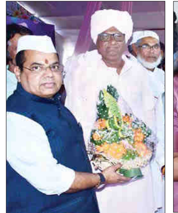
महानुभाव आश्रम के शतक पूर्ति महोत्सव में बोले संघ प्रमुख डा. मोहन भागवत