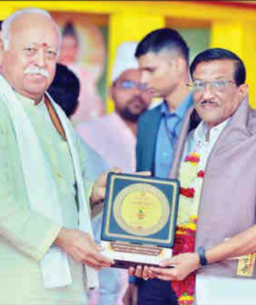
महानुभाव आश्रम के शतक पूर्ति महोत्सव में बोले संघ प्रमुख डा. मोहन भागवत

मैं लाना होगा और धर्म का वांछित कार्य करना होगा. यद्यपि धर्म को समझना कठिन है, लेकिन हृदय प्रसन्न हो गए तो इसे आसानी से समझा जा सकता है. लेकिन, जो अल्प ज्ञान से अहंकारवश फूला हुआ है, उसे तो ब्रह्मा भी नहीं समझा सकते. डा. भागवत ने कहा कि अतीत में धर्म के नाम पर जो अत्याचार हुए, वे गलत धारणाओं के कारण हुए. उन्होंने कहा कि ज्ञानवर्धक पंथ और संप्रदाय हमारे देश की शान हैं. विपरीत परिस्थितियों में भी महानुभाव संप्रदाय का कार्य अनवरत जारी रहता है और उसका सम्मान भी किया जाता है. संघ प्रमुख ने कहा कि चाहे कोई भी संप्रदाय हो, यह हमें एक-दूसरे से जुड़ना सिखाता है. एकता शाश्वत है. सारा विश्व एक है. अहिंसा से कार्य करना ही धर्म की रक्षा है. संघ धर्म की रक्षा के लिए काम कर रहा है. डा. भागवत ने इस बात पर भी जोर दिया कि जब सच्चे संकल्प के साथ काम किया जाता है तो वह अवश्य पूरा होता है.