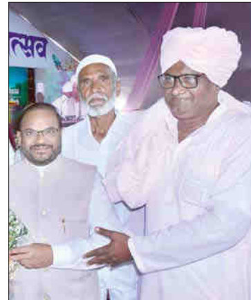
महानुभाव आश्रम के शतक पूर्ति महोत्सव में बोले संघ प्रमुख डा. मोहन भागवत