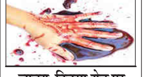
जावरा-तिवसा रोड पर हादसा, दो बैल गंभीर घायल

संवाददाता/प्रतिदिन अखबार तिवसा, 22 दिसंबर - एसटी बस क्रमांक एमएच-40/एन-9959 ने बैलगाड़ी को