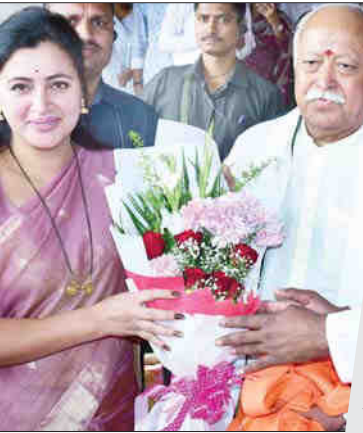
महानुभाव आश्रम के शतक पूर्ति महोत्सव में बोले संघ प्रमुख डा. मोहन भागवत