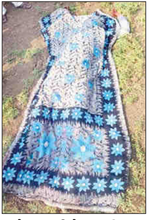
खोलापुरीगेट पुलिस थाना क्षेत्र की घटना