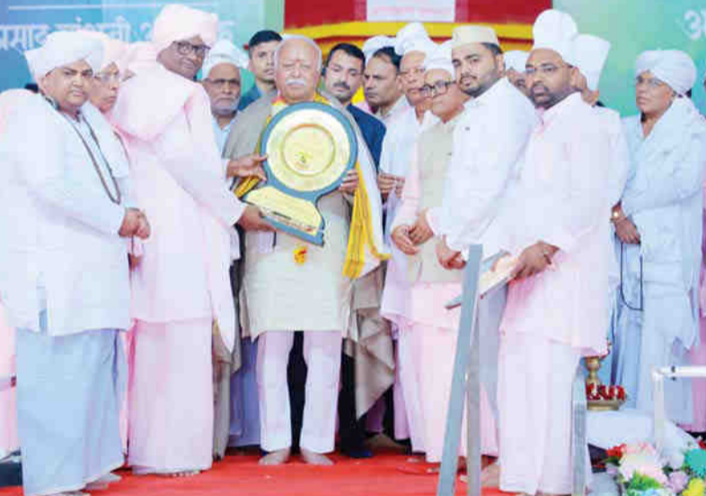
अमरावती: राष्ट्रीय स्वयं सेवक संघ (आरएसएस) के सरसंघचालक मोहन भागवत ने रविवार को महानुभाव पंथ के एक कार्यक्रम में हिस्सा लिया। कार्यक्रम में अपने संबोधन में मोहन भागवत ने कहा कि धर्म की गलत समझ के कारण दुनिया में सारा जुल्म हुआ है। ऐसे संप्रदाय होने चाहिए जो धर्म को समझाने का काम करें।

वन्दे भारत एक्सप्रेस का इंजन फेल एजेंसी/ प्रतिदिन अखबार जोनपुर, 22 दिसंबर - जोनपुर में लखनऊ से छपरा जाने वाली वन्दे भारत एक्सप्रेस (02270) का इंजन फेल हो गया है। हरपालगंज- करनपुर कुमारपट्टी गांव के पास ट्रेन शाम 5:15 बजे से खड़ी थी। दूसरे इंजन की मदद से ट्रेन को हरपालगंज स्टेशन पर ले जाया गया।